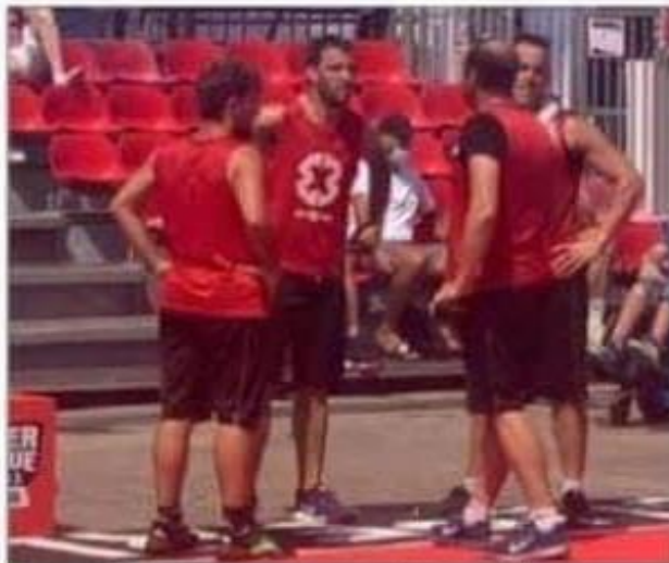
La Team Riviera de Carpentras termine au seizième rang au niveau national. Le D.U.P.B.

Pour la troisième année consécutive, l'équipe de Carpentras Riviera s'est qualifiée pour l'open de France 2021 qui a eu lieu à Lille du 15 au 17 juillet.