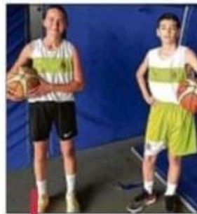
Les deux jeunes licenci s.