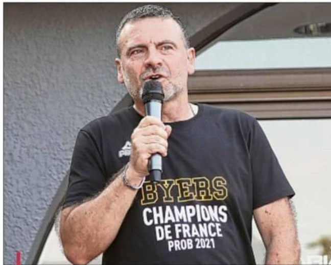
Finies les festivités. Depuis plusieurs semaines, les dirigeants provençaux se sont mis au travail avec une intersaison très chargée sur les plans sportif et structurel.

C'est ça. Nous avons du mal à réaliser lorsque l'on voit les transferts réalisés par les grosses équipes. J'ai encore vu ce matin(hier) Fall à l'Asvel... Nos ambitions sont claires, c'est le maintien. C'est pour cela que nous avons souhaité garder l'ossature de la saison passée avec sept joueurs. Il fallait aller au bout de l'aventure. "Vous vous êtes battus pour y accéder, vous méritez d'y participer". C'est le sens donné au choix de prolonger l'ossature de l'équipe. Outre Lasan Kromah, une valeur sûre de la ProA, on cherche encore deux renforts. On compte beaucoup sur la cohésion de l'équipe pour faire des résultats.