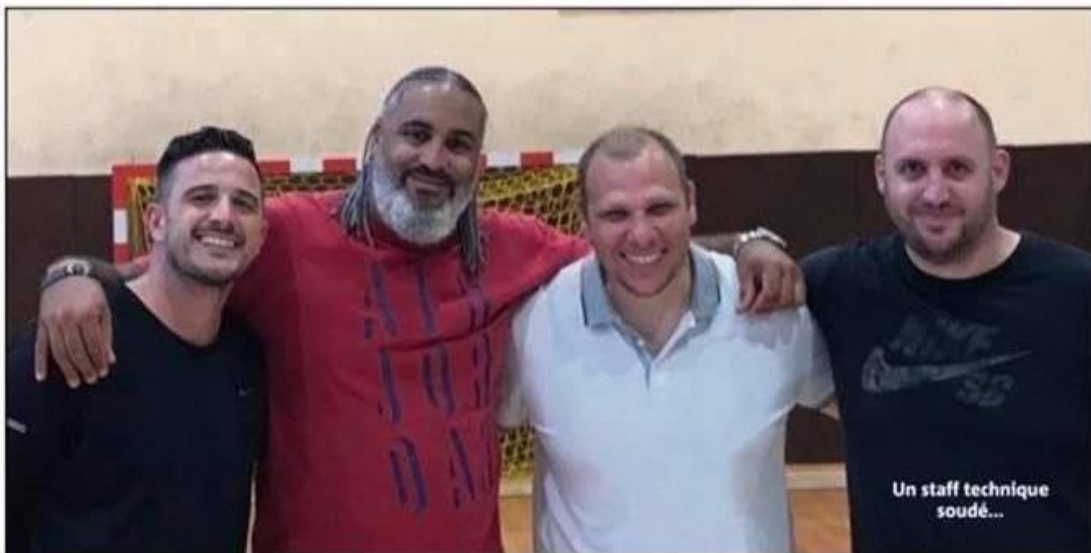
Un staff technique soudé...

Textes : PHILIPPE HERBET pherbet@nicematin.fr