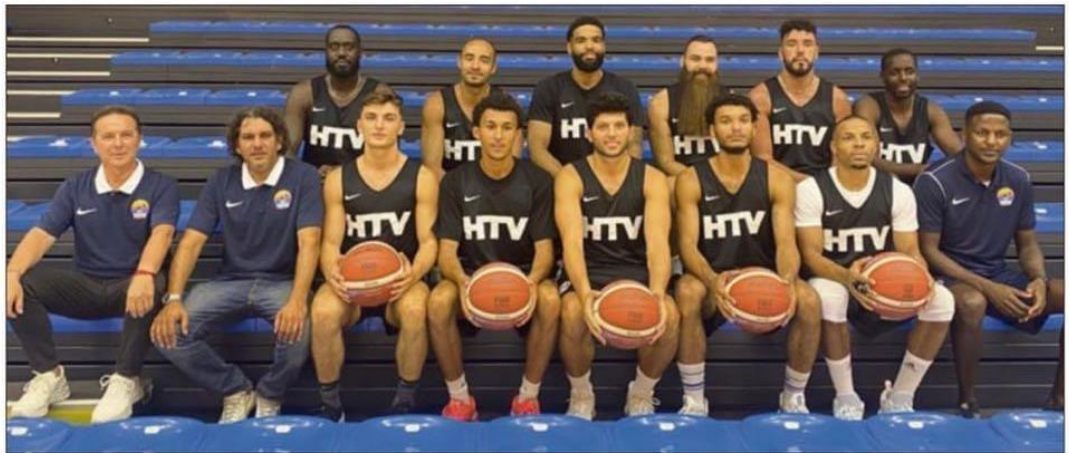
Les joueurs de Hyères-Toulon débiteront leur championnat le 11 septembre, avec un déplacement à Aubenas.